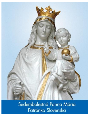
Sedembolestná Panna Mária Patrónka Slovenska

Sviatok Sedembolestnej Panny Márie si pripomínáme každý rok 15. septembra. Pápež Pavol VI. vyhlásil v roku 1966 Panu Máriu za hlavnú Patrónku Slovenska. Prvá zmienka o sviatku Sedembolestnej Božej Matky pochádza už z roku 1412.